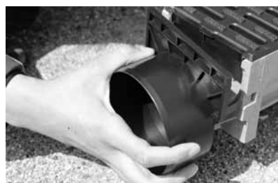
De twee A-clips in de kopse kant v/d goot vastklikken.