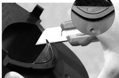
Y-deel uitsnijden met een mesje.