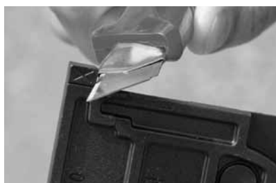
Snij het X-deel af met een mesje