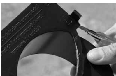
Door het Y-deel uit te snijden wordt een maximale doorstroming verkregen.